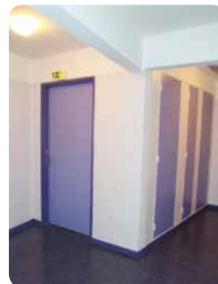
> remplacement des sols et réfection des peintures des cages d'escalier [résidence « La Saline »]

Résidence « Lecanu IV » à Équeurdreville-Hainneville remplacement des verrières