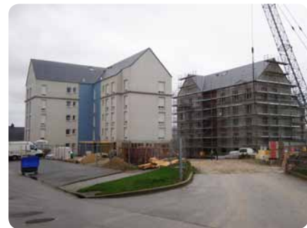
> Résidence Marie Ravenel, dont la livraison est prévue pour juin 2012

La livraison est prévue pour fin juin 2012.